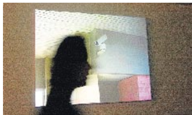
Exposición 'Cámara' en Fundación Telefónica. J.V.